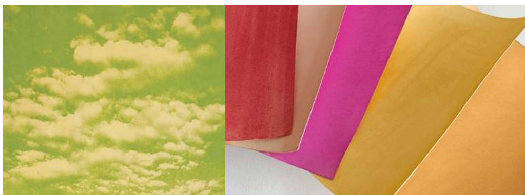
Nuages, anthotype d'épinards, Atelier Mille Lieues.