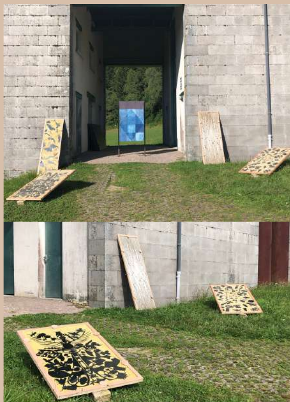
Châssis d'anthotypes exposés à la lumière du soleil (images en cours de révélation),

Les couleurs de l'île, Centre International d'Art et du Paysage, Île de Vassivière, été 2023, Diane Etienne, Atelier Mille Lieues.